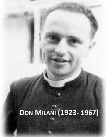
DON MILANI (1923- 1967)