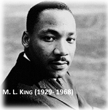
M. L. KING (1929- 1968)

Se la conflittualità è insita nella natura delle cose, qual è il fondamento dell'ipotesi che in nessun caso la guerra sia la soluzione alle controversie?