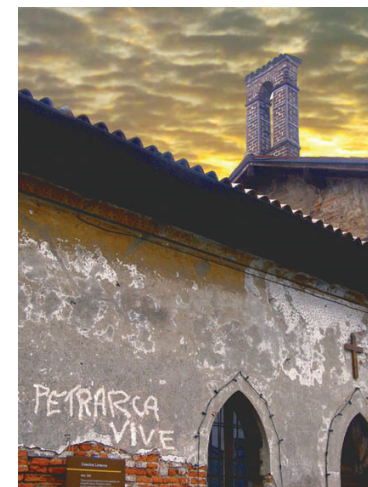
Cascina Linterno

Si ringraziano, per il Patrocinio alla pubblicazione: